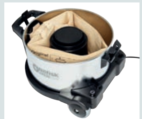
Издръжлив стоманен контейнер и 15-литрова торба за прах