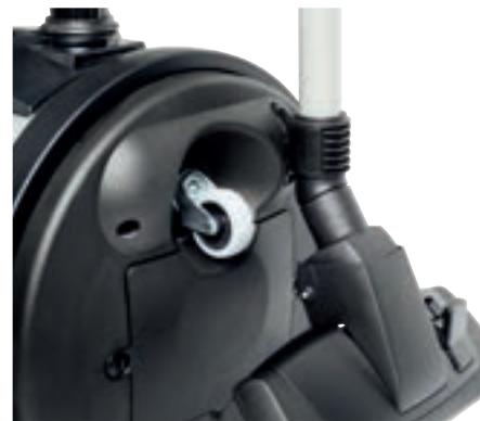
Решение за паркиране като стандартно изпълнение