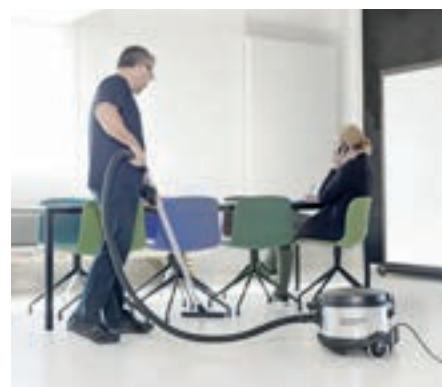
VP930 е отличният избор за възискателни приложения, например в офиси, хотели и обществени сгради