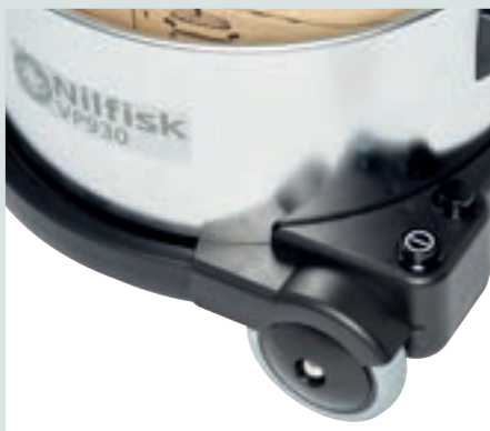
Някои разновидности разполагат с функция за две скорости