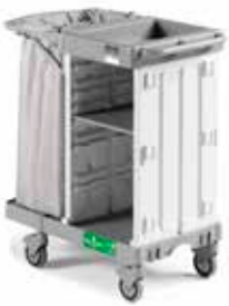
Art. 0300HA2300U05 cm 99x58x107 h