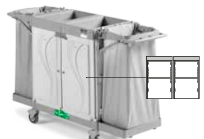
Art. HA0603004U000 cm 177x58x107 h