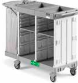
Art. 0300HA5300U06 cm 142x58x107 h