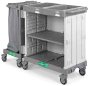
Art. 0300HR5300U98 cm 153x58x107 h