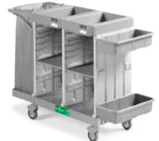
Art. 0300HA5304U06 cm 153x58x107 h