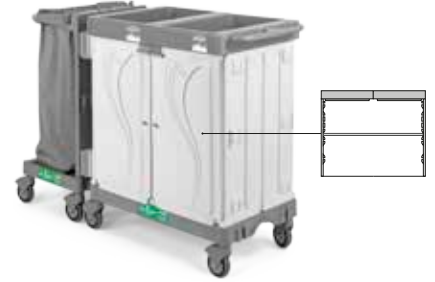
Art. HR0603006U000 cm 153x58x107 h