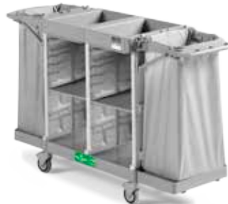
Art. 0500HA5301U06 cm 177x58x107 h