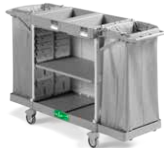
Art. 0500HA5301U98 cm 177x58x107 h