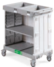
Art. 0000HA5302U98 cm 97x58x107 h