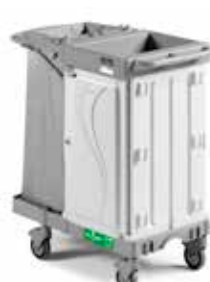
Art. 0300HA3300U05 cm 99x58x107 h