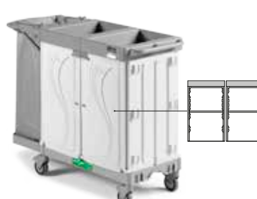
Art. HA0603003U000 cm 142x58x107 h