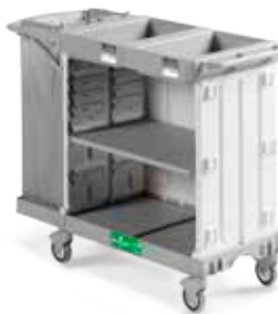
Art. 0300HA5300U98 cm 142x58x107 h